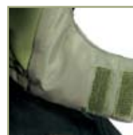
Удобный регулируемый капюшон.