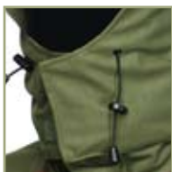
Удобный регулируемый капюшон.