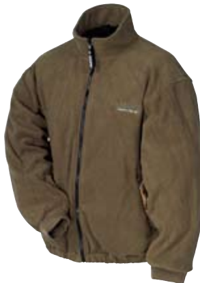
Отстегивающаяся внутренняя куртка.