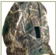
Регулятор глубины капюшона.