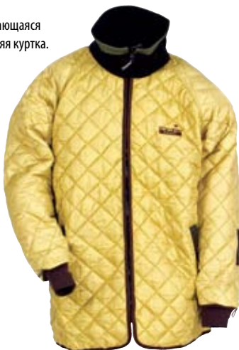
Отстегиваемая внутренняя куртка.