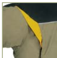
Удобный крой костюма.