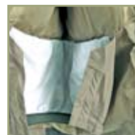
Внутренняя снегозащитная юбка.