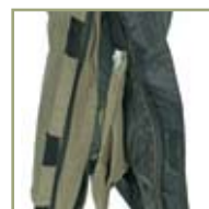
Застежка-молния внизу штанов с клапаном на «липучке».