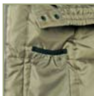
«Теплый» карман для мобильного телефона.