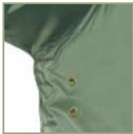
Дополнительная вентиляция куртки.