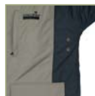
Дополнительная вентиляция куртки.