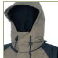
Удобный регулируемый капюшон.