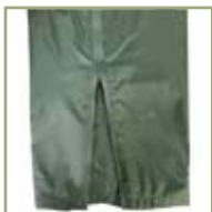
Застежки-молнии с клапанами.